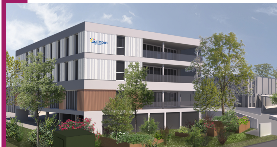
Perspective du nouveau siège du Groupe Galopin – Emergence Architecture

Chargé d'affaires opérations en tous corps d'état