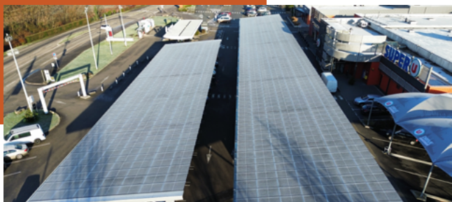
Super U , Bitschwiller-lès-Thann Centrales sur ombrières - 361 kWc - En site occupé

Directeur GALLIM Énergies Groupe Galopin