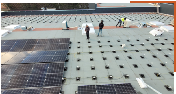
Magasin Trèfle Vert , Wittenheim Centrale en toiture - 124 kWc