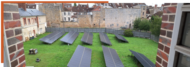
École des Mines , Fontainebleau Centrale au sol - 99 kWc