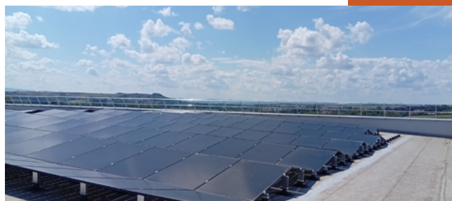
Usine Usocome , Brumath Centrale en toiture - 598 kWc